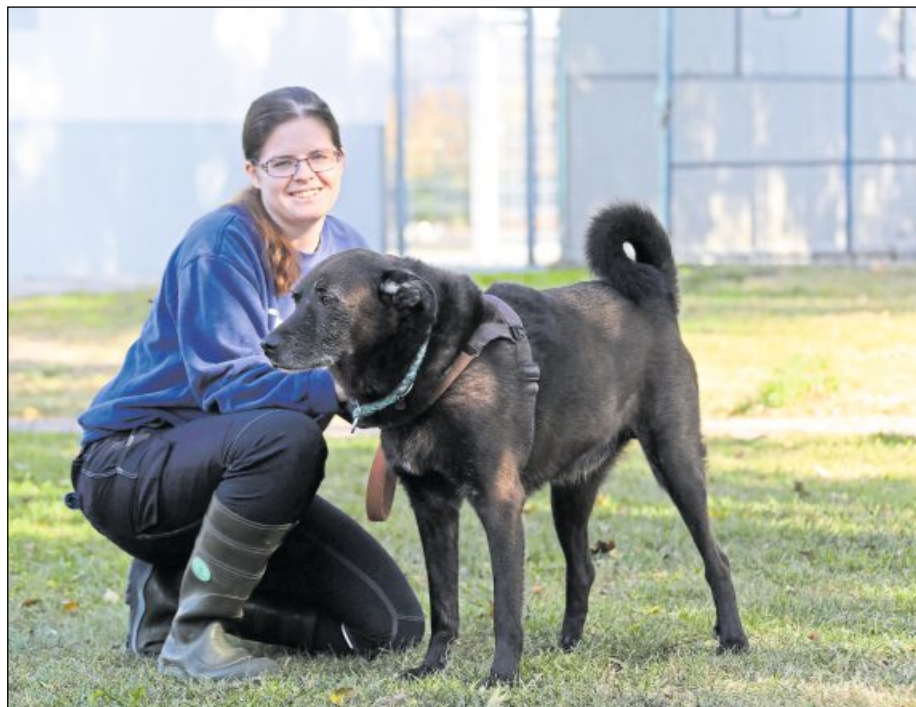
TROTZ SEINES HOHEN ALTERS geht der zehnjährige Baghira noch sehr gerne spazieren. Der große Mischling wäre als Zweithund zu einer Hündin geeignet.

Infos zu den Tieren erhält man unter Telefon 95 07 80 oder auf der Homepage: www.tierheim-karlsruhe.de